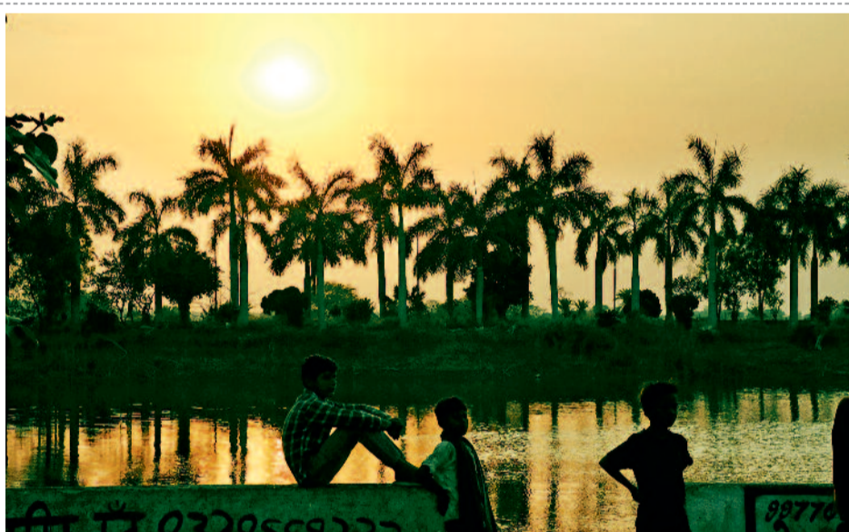
रायपुर। परीक्षाओं का तनाव पीछे छोड़, बच्चे अब बेफिक्र हैं। तालाब के शांत किनारे पर डूबते सूरज के साथ उनका खेल और हंसी, बचपन की सादगी और निश्चल खुशियों का एक यह दिल्कश नजारा है।